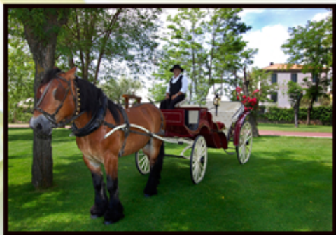
Llegada en Coche de Caballos y Coro Rociero

Celebre con nosotros y en compañía de los suyos, sus momentos más especiales, y beneficiese de todo cuanto podemos ofrecerle sin coste adicional.