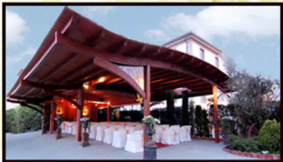
Ceremonia de aniversario totalmente equipada y oficiante